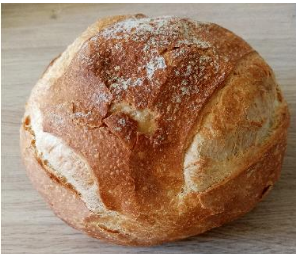
Petite boule coupée de 200 g à 1.35 €