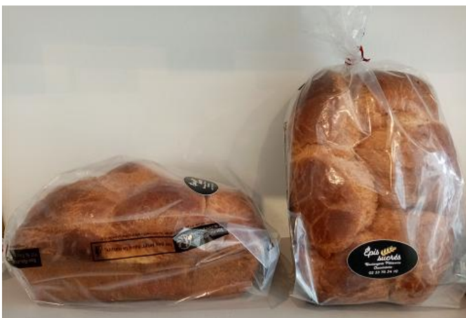
Galette briochée 6 personnes longue conservation à 7.25 €