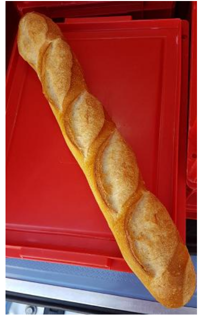
Baguette de 200 g à 1.20 € Ou ½ baguette moulée à 0.60 €

Vous pouvez commander du pain en même temps que vos menus.