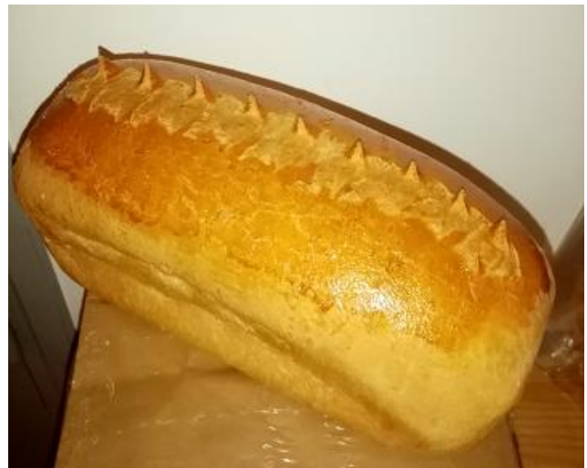
Pain de mie coupé de 250 g à 2.05 €